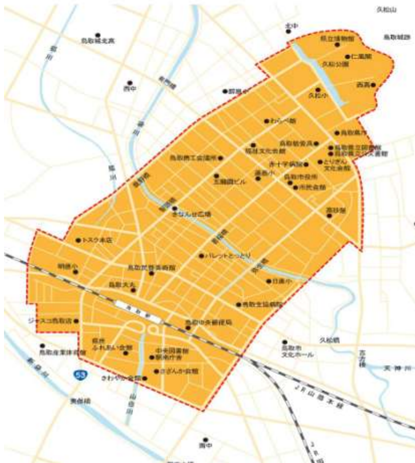
鳥取市中心市街地活性化基本計画区域図

このアンケートにおける「中心市街地」は、鳥取市中心市街地活性化基本計画で定める区域（210ha）とします。（下記にイメージ図を掲載）