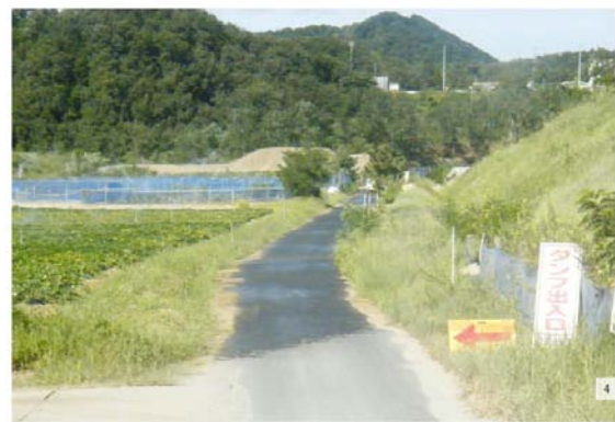
市道湖山町南三津線 現況写真②