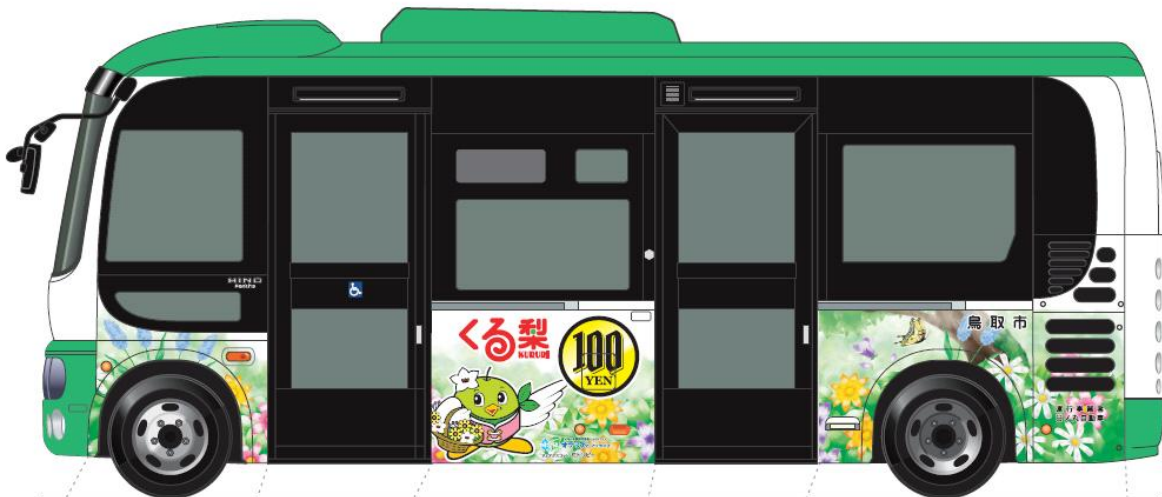
バス意匠図A案 側面助手席側