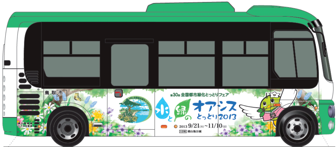
バス意匠図A案 側面運転席側