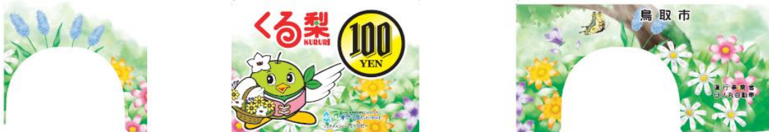
マーキング範囲 ※一部文字列はカッティングシート