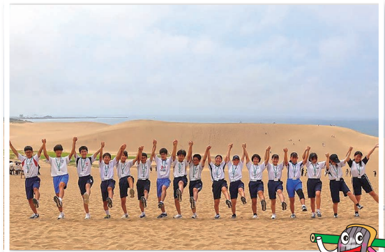
「平成 26 年度姫路市・鳥取市中学生合宿交流会」