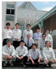
鳥取センターの職員

鳥取には経験豊富で優秀な人材が多く、鳥取センターの業務運営に大変役立っています。今後も、この地から「普及率ゼロの商品」を全国の消費者に届けられるように新たな商品開発をしていきたいと考えています。