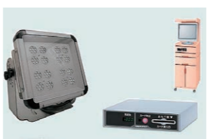
300W投光器と磁気カードリーダー

所在地 若葉台南七丁目 5-1 従業員数 11人(グループ全体45人) 業務内容 LED照明、カードリーダーの設計開発