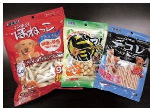
鳥取工場で製造している商品