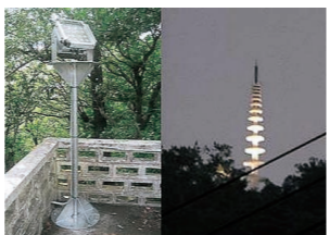
平和の塔を照らす300W投光器