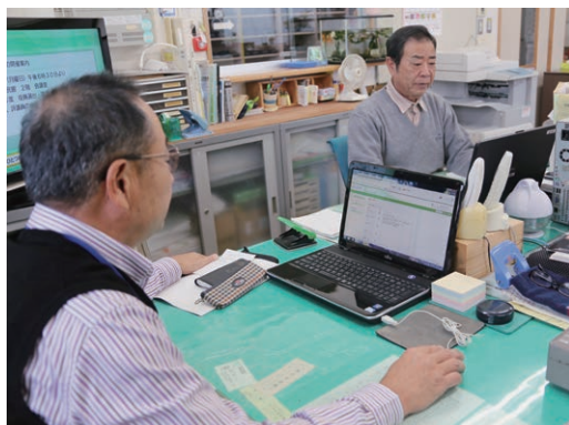
パソコンで簡単に情報登録

電子掲示板は、使ってみればとてもいいものなので、どの地域も活発に利用している側とは思っています。発信する側としては、掲示板に写真などが掲載できるとより興味を持ってもらえると思います。