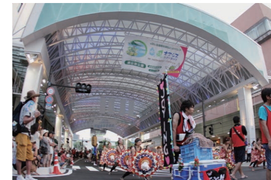
しゃんしゃんウィークー斉踊り

昨年7月7日にオープンした全天候型にぎわい空間『駅前太平線バード・ハット』では、新鳥取駅前地区商店街振興組合が管理運営主体となりさまざまなイベントを行ってきました。その効果、平成26年の新たな取り組みについてお知らせします。 ☎ 本庁舎中心市街地整備課 ☎ 0857-20-3278