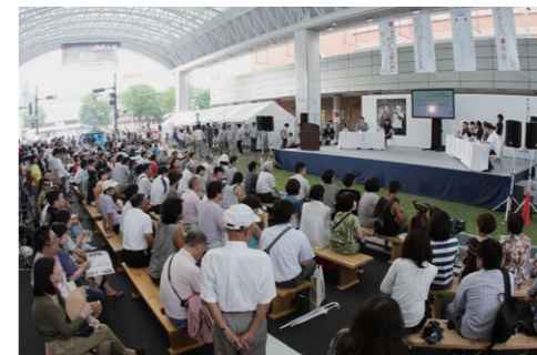
エンジン02メインフォーラム

バード・ハットでは、オープンから半年間、週末を中心に36のイベントを開催してきました。その内容は、エンジン02や因幡の塩鯖まつりといった飲食イベントや、音楽ライブ、七五三ファッションショーといったステージイベントなど、非常に多彩なものでした。また、公開ウエディングと、この空間ならではのユニークな取り組みもありました。