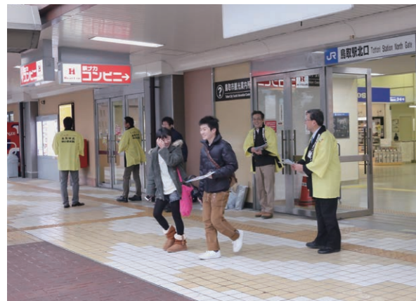
1月4日、鳥取駅で帰省客にふるさと納税を積極的にPRしました。

平成24年度12月末時点では、件数：552件、金額：11,712千円。前年同期と比較して、件数で12.3倍、金額で10.1倍と大幅に増加しています。