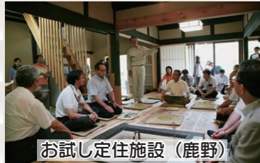
お試し定住施設(鹿野)