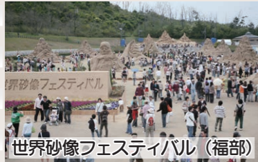
世界砂像フェスティバル(福部)