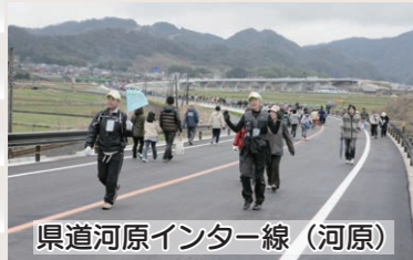
県道河原インター線(河原)