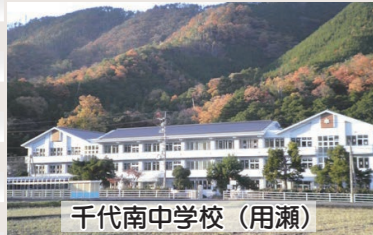
千代南中学校(用瀬)