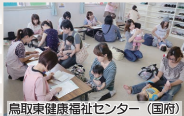
鳥取東健康福祉センター(国府)

世界認定の山陰海岸ジオパークのエリアを、気高、青谷、鹿野まで拡大するよう進めています。本市には鳥取砂丘の砂を活用した砂像や「地下の弥生博物館」と称される青谷上寺地遺跡など、豊かな自然や歴史的な遺産、伝統工芸品など数多くの地域資源があります。これからは、人・物・情報の交流を活発にして、地域間の連携を強化し、全市一体となって大きく未来へ飛躍する、夢のあるまちづくりに取り組んでいきます。