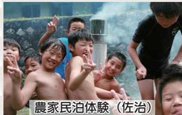
農家民泊体験(佐治)