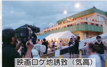
映画ロケ地誘致(気高)