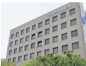
本社オフィスビル