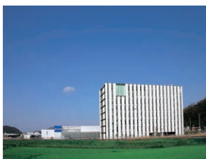
本社テクニカルセンター