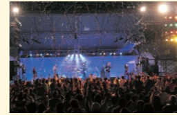
昨年のおかやま国際音楽祭の様子

「おかやま国際音楽祭」では、野外や街角で音楽の喜びを分かち合う無料コンサート、芸術性の高いホールコンサートなど、誰もが楽しめるイベントを岡山の持つ豊かな「水と緑の音楽空間」で提供します！ぜひ、秋の岡山をお楽しみください。