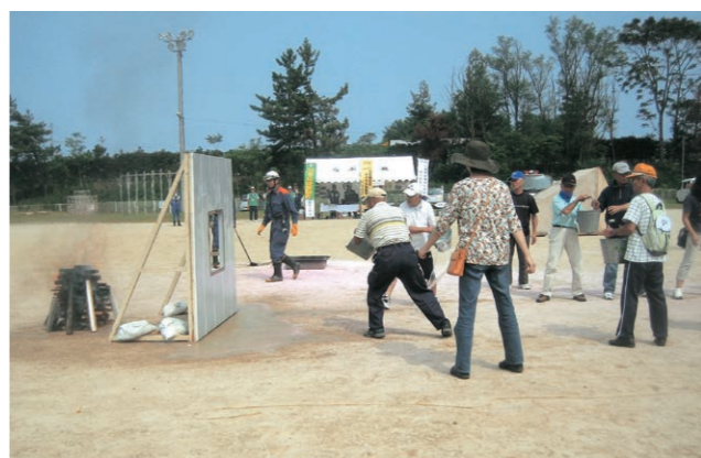
自主防災組織による初期消火訓練

※登録についてのお問い合わせは 障がい福祉課 TEL(0857)20-3474 /各総合支所市民福祉課 FAX(0857)20-3406