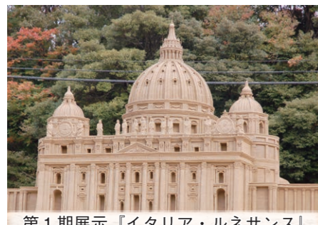
第1期展示「イタリア・ルネサンス」