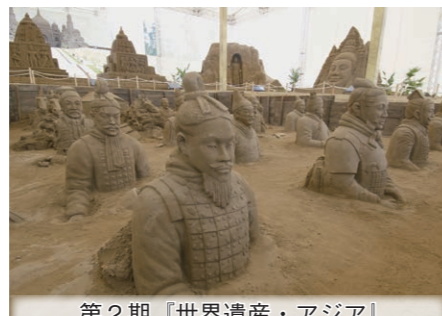
第2期「世界遺産・アジア」