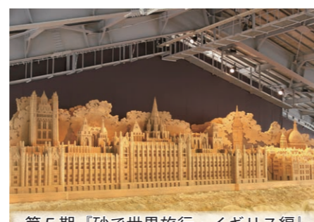
第5期「砂で世界旅行・イギリス編」

第8期展示 4月18日(土)9:00オープン！ 砂で世界旅行・ドイツ編 ～中世の面影とおとぎの国を訪ねて～