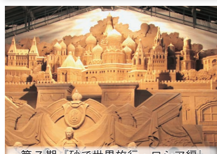
第7期「砂で世界旅行・ロシア編」

第8期展示 4月18日(土)9:00オープン！ 砂で世界旅行・ドイツ編 ～中世の面影とおとぎの国を訪ねて～