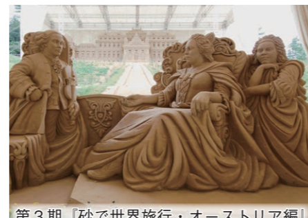
第3期「砂で世界旅行・オーストリア編」