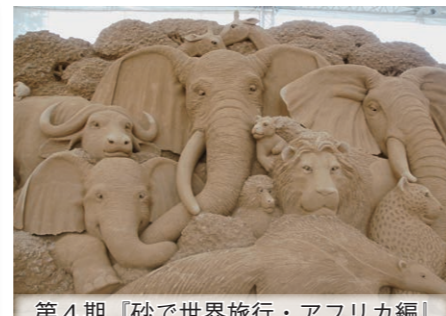
第4期「砂で世界旅行・アフリカ編」