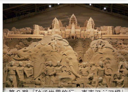
第6期「砂で世界旅行・東南アジア編」