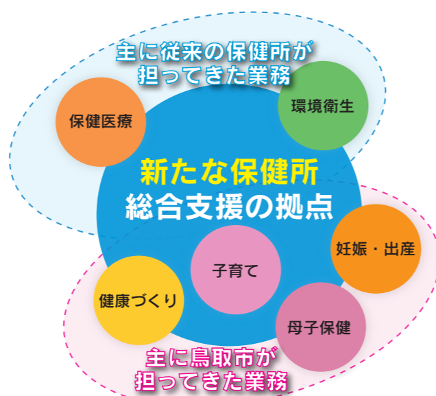
新たな保健所のイメージ