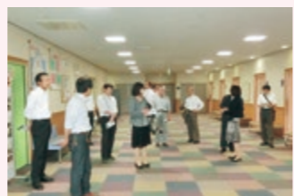
健診待合フロアは広いスペースを確保

整備することとしています。倉敷市の保健所の施設では、保健センター業務も行っており、その隣に子どもからお年寄りまですべての市民が健康で生きがいのある生活を営むための支援施設「くらしき健康福祉プラザ」を有することで、周辺一帯が市民に身近なエリアとなっています。