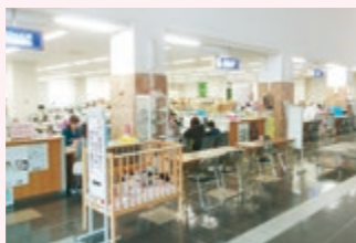
各手續窓口はワンストップサービスを実現

本市は、駅南庁舎に新たな保健所、保健センター、子育て支援機能を集約し、業務の連携強化を図り、保健医療・環境衛生・子育てなどの総合支援の拠点として