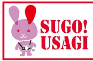
キャンペーンキャラクター

◆「SUGO! USAGI」をキャラクターに起用し動画や画像を用いたスペシャルサイトを中心に、鳥取市のまだ外に知られていない魅力的な情報を全国に発信