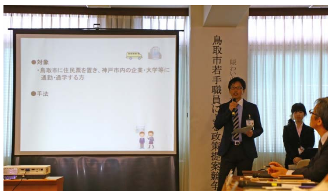
政策提案チームによるプレゼン