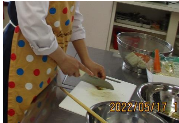
食材は参加人数に合わせて購入します。 すなはま農園で収穫した野菜も使いました。