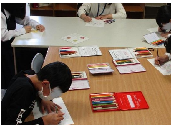
午後の学び合い活動の様子です。好みの まんだら模様の色をつけていきました。