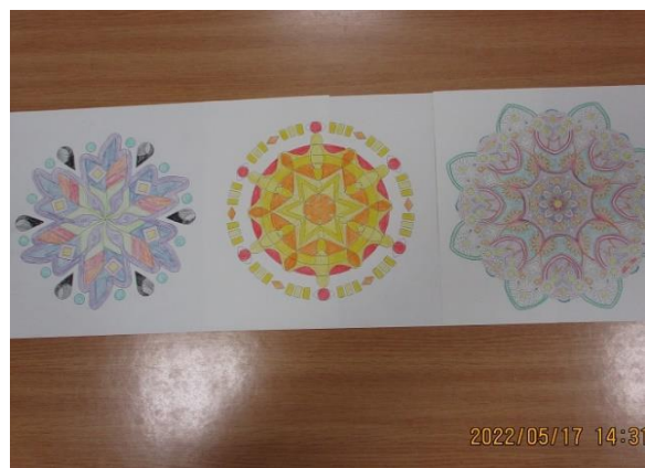
細かい作業でしたが、彩りよく素敵な 作品に仕上がりました。