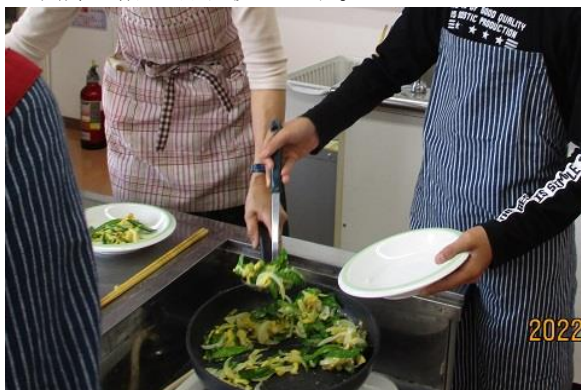
調理は分担して作り、人数に合わせて お皿に盛りつけていきます。