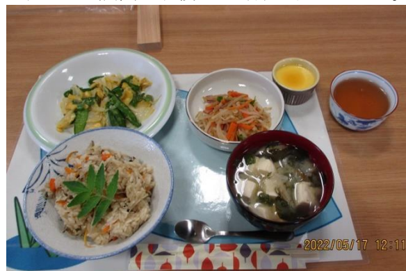
完成しました! もやしの風味和え、み そ汁、プリンも手作りで。