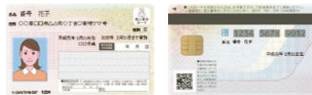
個人番号カード（表） 個人番号カード（裏）

個人番号カードを取得した場合には、番号確認と身元確認がこのカード1枚で可能です。