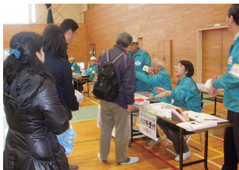
避難所の受付訓練