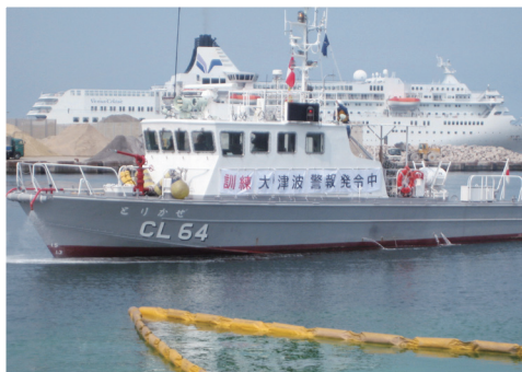
鳥取港会場での津波警報伝達訓練