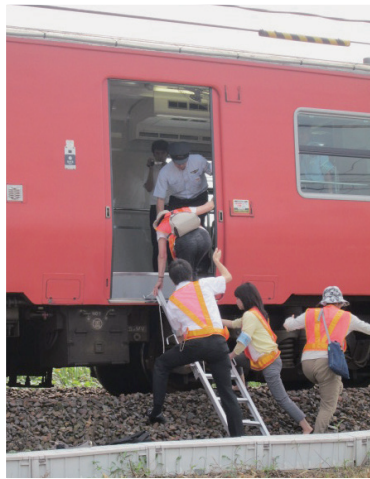
JR西日本による避難誘導訓練