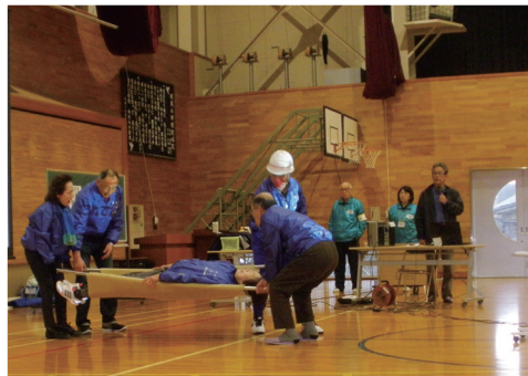
救助者の搬送訓練

小学校会場では、地域住民による避難所の開設・運営体験、防災関係機関の装備展示など、鳥取港会場では、海上被災者の救助・艦艇による消火活動など、青谷地域会場では9月6日にJR西日本による乗客の避難誘導訓練など、鳥取駅前地区会場では防災啓発イベントなどが行われます。