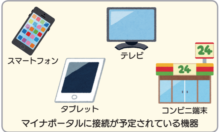
マイナポータルに接続が予定されている機器

マイナンバーの利用には、インターネットに接続するための機器が必要です。お持ちのパソコンのほか、スマートフォンやタブレット、コンビニ端末などの利用も考えられています。また、パソコンなどをお持ちでない人にもマイナンバーを利用いただけるよう、ケーブルテレビを使った接続