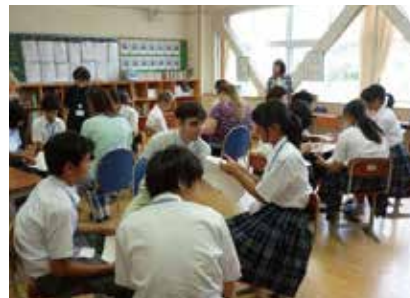
外国人講師による英語教育の推進