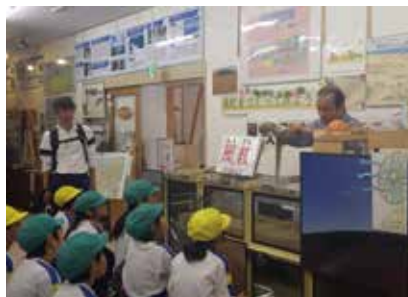
山陰海岸ジオパーク学習会

小中学校兼務教員の配置による「ふるさとを思い 志をもつ子」の育成をめざした特色ある中学校区の創造など郷土愛を育む教育を推進します。