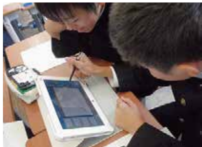
タブレットを活用した授業

地域創造学校やICTの活用、英語教育の推進など次世代を見据えた特色ある教育を推進します。