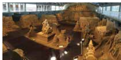
鳥取砂丘砂の美術館