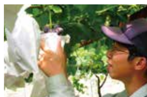
とっとりふるさと就農会による 新規就農支援

※1 クラウドファンディング: インターネット上のサイトを通じ、アイデアを実現するために必要な費用を、その アイデアに共感した不特定多数の人々から集める資金調達手法。