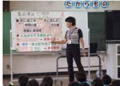
小中学校をつなぐ兼務教員