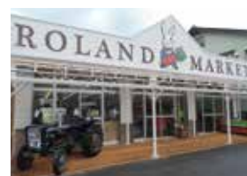
クラウドファンディング※1を 活用した新規創業支援