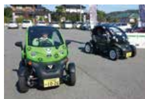
エネルギーの地産地消の推進 (超小型モビリティ)