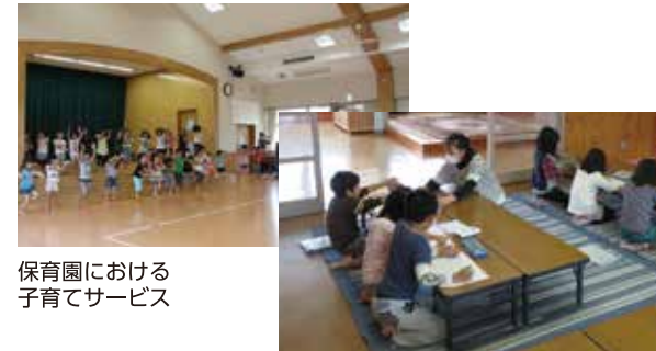
保育園における子育てサービス

子育て世帯の保育料の軽減や地域型保育による待機児童ゼロの継続、病児・病後児保育をはじめとする特別保育など子育てサービスの充実に取り組みます。