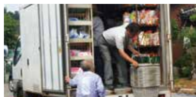
移動販売車による買い物支援