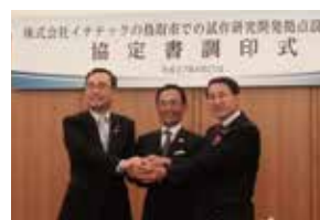
企業誘致の推進 (企業進出に伴う協定書調印式)