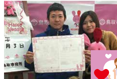
「すごい!鳥取市婚活届用紙」で思い出に残る結婚を!

「すごい!鳥取市婚活サポートセンター」やまちづくり団体等による出会いの創出から結婚に至るまでのトータルサポートを行います。