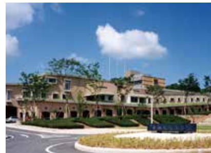
公立鳥取環境大学