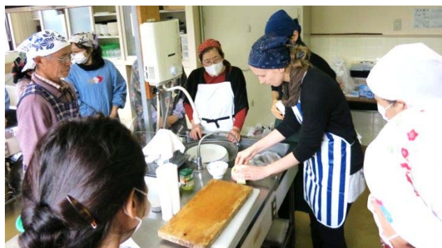
「フィンランド料理教室」