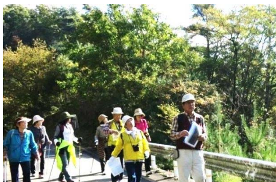
「ふるさと林道ウォーキング」