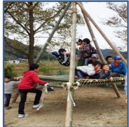
竹のツリーハウス 最高！ なんと、ハンモック付き！