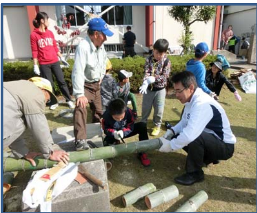
ご飯を炊く竹筒づくり 三世代でのこぎりを引いたよ！