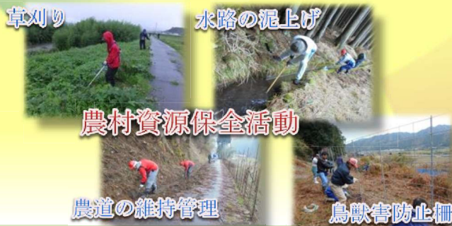
農村資源保全活動