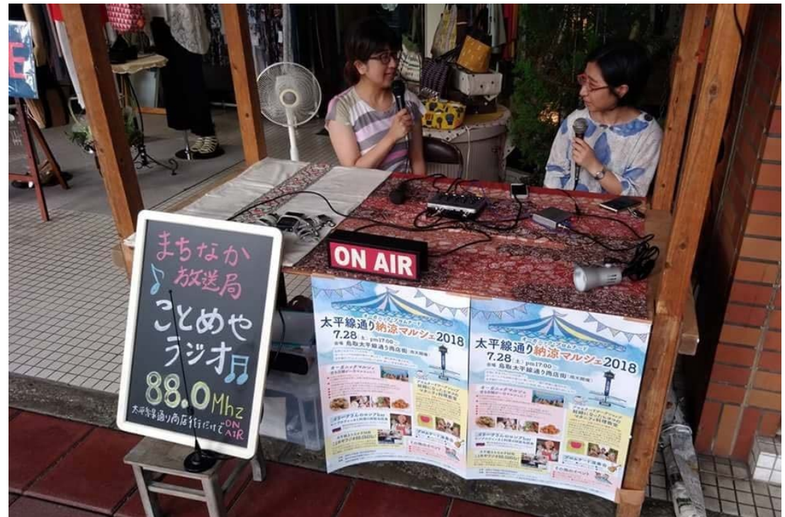
(衣料品店の軒先に放送ブースが出現)

瓦町にあるコワーキングスペース「ことめや」を拠点に、半径数メートルしか届かない微弱電波を出しながら放送しているミニFM放送局「ことめやラジオ」。個人の小さな趣味みたいな活動がまちなかに飛び出しました。7月28日、鳥取太平線通り商店街の納涼マルシェに初出店。ブースでは、ライブの出演者や商店街の方にゲスト出演していただいたり、通りがかりに興味をもって足をとめてくださった方と会話をしてみたり。まちなかでの新たなコミュニケーションツールとして、多くの方におもしろがっていただきました。