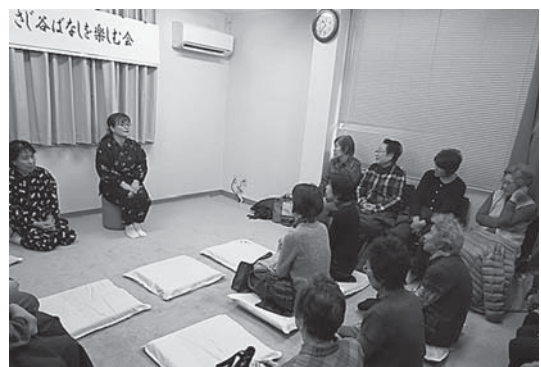
さじ谷ばなしを楽しむ会:用瀬図書館