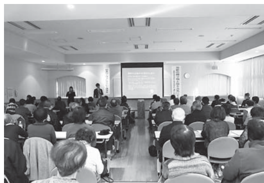
健康長寿講演会：気高図書館

本のリサイクル市の開催 2 回開催 約350人来場 3,800冊提供 その他 館内展示会場提供 11件、会議室提供 93件 気高町文化祭への参加協力