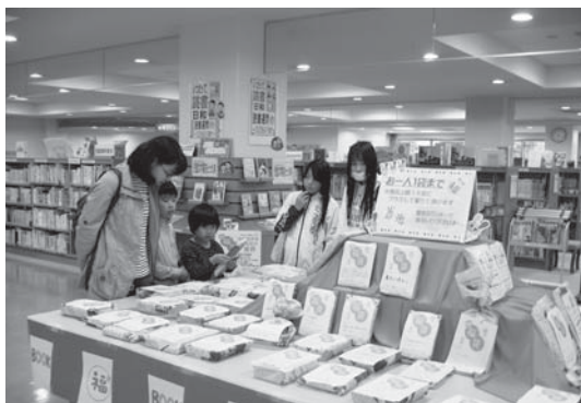
福* (BOOK)袋から広がるあなたの世界：中央図書館