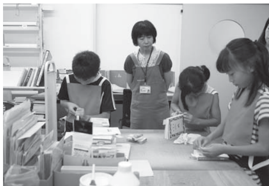
夏休み 図書館での司書体験：中央図書館