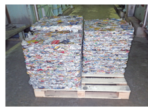
選別され圧縮された資源物