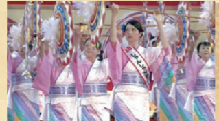
しゃんしゃん傘踊り