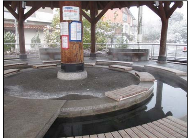
ゆうゆう健康館けたか足湯