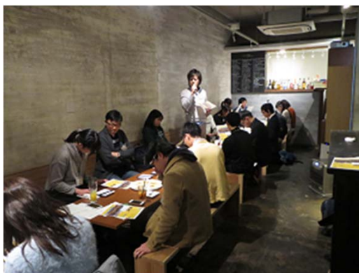
←ゲストスピーカーからの総括と イベント紹介