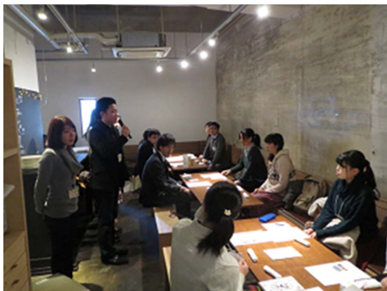
↑ イベントの趣旨を説明