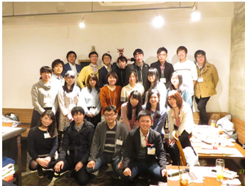
参加者全員で記念撮影→