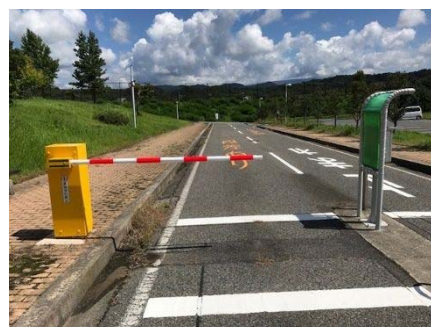
事故後すぐに大学所有の予備のポールと交換