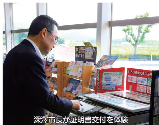
深澤市長が証明書交付を体験

手数料や送付を受けるための郵送料が必要な電子申請については、クレジットカードが必要となります。手数料などの支払いが確認でき次第、証明書・許可証などを送付します。