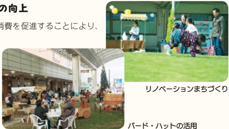
リノベーションまちづくり