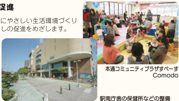
本通コミュニティプラザすぺーす Comodo