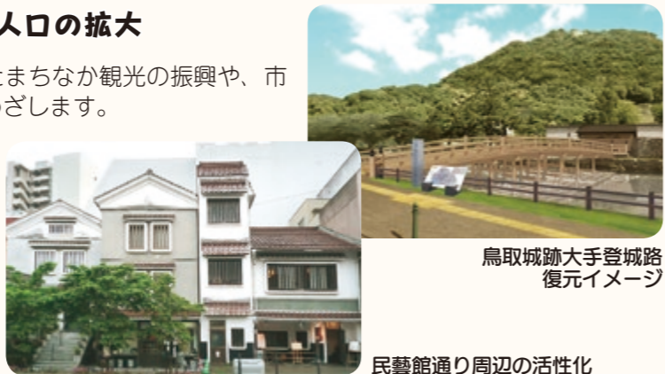
鳥取城跡大手登城路復元イメージ