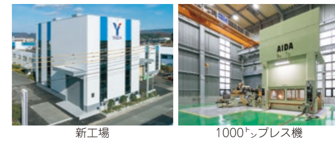
新工場 1000トプレス機

◆ 当社の強み 2017年で創業50周年を迎えるのを機に、大型(5面加工)マシニングセンタ、1000トプレス機など、金型専門メーカーとしては全国有数の大規模な設備の増強を行い、重量10トクラスまでの大型金型、また難加工材金型の開発/製造にも積極果敢に取り組んでいます。 また、生産現場のIT化にも取り組んでおり、昨年5月には経済産業省より「攻めのIT経営中小企業100選」に選ばれました。今後もIoT導入実証へ取り組みながら、更なる生産性の向上を目指したスマート工場づくりに取り組んでゆきます。