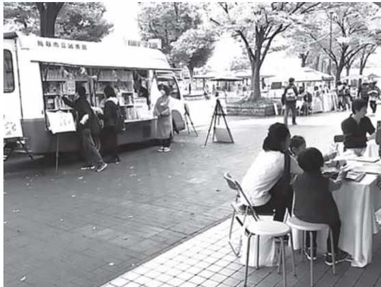
移動図書館車がとっとり駅前マルシェに参加：中央図書館