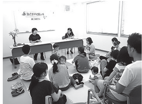
読んでもらおうと楽しいな：気高図書館

地区公民館、福祉施設への団体貸出、気高町ときめき祭りへの参加協力（つばさ号での貸出など） 図書館だよりの発行、行事案内のチラシ等広報活動 その他 館内フロア提供1件、会議室提供16件