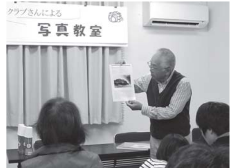
用瀬写真クラブさんによる写真教室：用瀬図書館