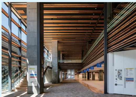
天井に地元産材を使った東口の吹き抜け(1階)