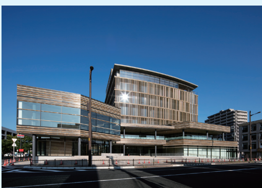
国道53号から見た新本庁舎

新本庁舎は建築工事が終了し、開庁に向け、現在システムなどの整備や移転準備作業を進めています。新本庁舎は10月15日(火)から11月5日(火)までに順次開庁します。新本庁舎への各部署の移転スケジュールはとっとり市報9月号をご覧ください。