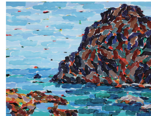
チョン イルヨン ソウル大学校西洋学科卒業。ソウル大学校大学院西洋画専攻終了。2019「存在の生々しさ」(恩平文化芸術会館・ソウル)、2018「目に見えないもの」(ギルダム書院・ソウル)で個展。

今年で12回目を迎える「岩美現代美術展」。この美術展はアーティスト・イン・レジデンス(現地滞在制作)方式により、アーティストが岩美町内に滞在しながら作品制作・展示を行う展覧会です。