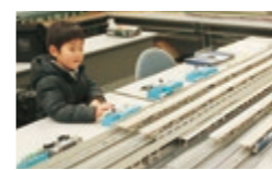
協力/鉄道サークル「鉄」

やまびこ館に鉄道模型や乗れるミニトレインが走ります。おもてなしイベント（お茶の振る舞いなど）も同時開催。 と き 1月13・14日（日・月祝）10:00～16:00 料金 無料