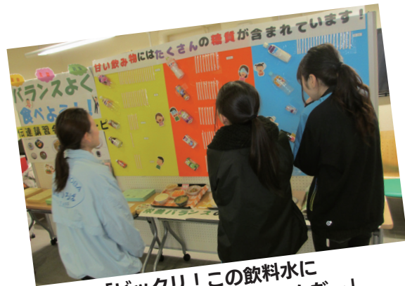
「ビックリ！この飲料水にこれだけの糖分があるんだ…」

私たちが取り巻く社会情勢がめまぐるしく変化していく中、不規則な食事や栄養の偏り、それに伴う生活習慣病の増加をはじめ、食に関するさまざまな課題がみられる現在だからこそ、生涯を通じて食育が非常に重要な役割を担っています。今一度、毎日の食事や食習慣をはじめ、「食」について考えてみてはいかがでしょうか。