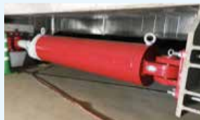
地震の揺れを吸収する免震オイルダンパー