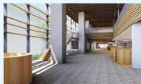
託児室などを備えた明るいロビー（イメージ）