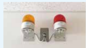
聴覚障がい者に災害などを伝える表示灯をトイレなどに設置