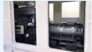
屋上に設置した非常用発電機