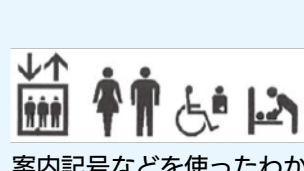
案内記号などを使ったわかりやすいサイン