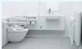
多目的トイレ（イメージ）