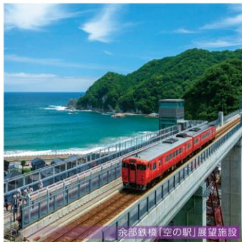
余部鉄橋「空の駅」展望施設