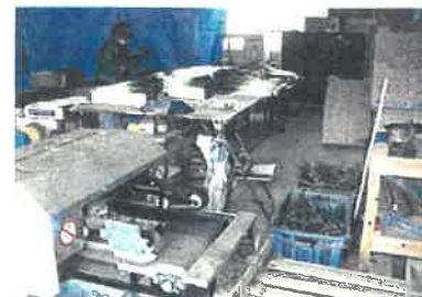
農機具庫・作業スペース

研修宿泊施設：鉄骨造 2階建 432㎡ 敷地面積：721㎡ 研修生個室：6室 農業体験者用2人部屋2室 駐車場：有 所在地：鳥取県鳥取市国府町麻生3-3