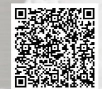
鳥取市公式ホームページ「新型コロナウイルス 関連」

新型コロナウイルス感染症は、市民生活にもさまざまな影響を及ぼしています。長期的な対応を求められる中で、感染拡大の防止とあわせ、社会経済活動の維持にも配慮した取り組みへの移行も課題となっています。この特集では、本市が取り組む市民の「いのち」と「くらし」を守る施策についてご紹介します。