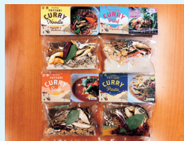
鳥取カレーキット セット

化学調味料や添加物など一切不使用の、体に優しい鳥取カレーの素をベースに作られたコラボカレーキット4種類のセットです。主役の椎茸をはじめ、たっぷりの乾燥野菜の凝縮された旨味がスープに溶け出した、手軽に作れて美味しいカレーです。アウトドアや備蓄にも使えて便利で、お洒落なパッケージは贈り物にもおすすめです。