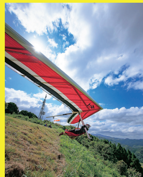
@ev.s.64 さん「Fly High!」

食欲の秋、読書の秋、スポーツの秋...何をやってもすてきな季節です。この写真みたいなハンググライダーやってみたいです!