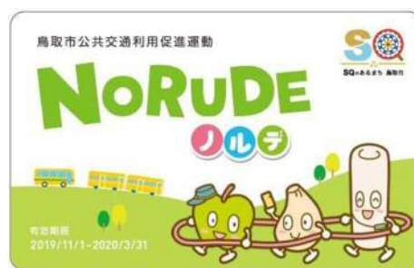
「ノルデカード」イメージ