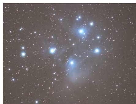
観察会のイメージ