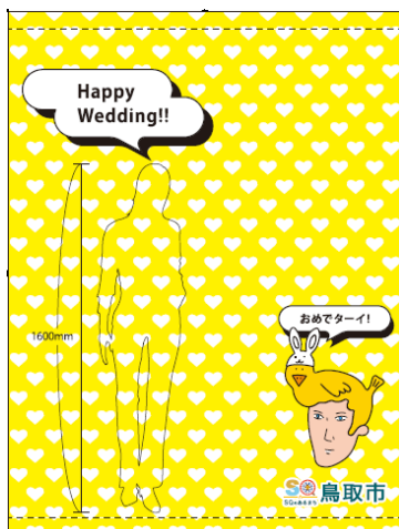
○バックのクローズ