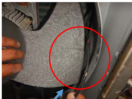
亀裂（上部のみ）、断線（上下共）