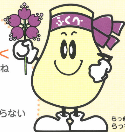
らっきょうの なっちゃん