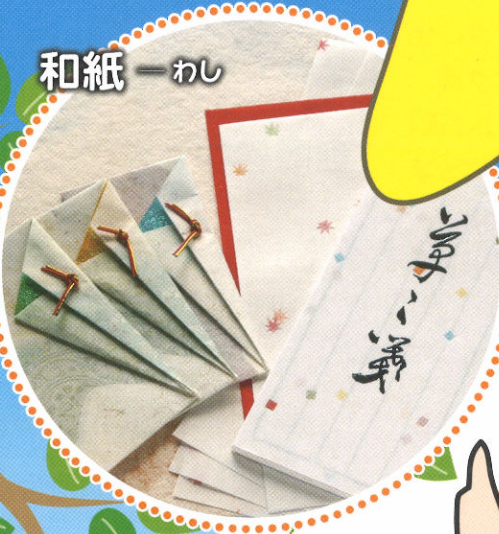
和紙 - わし