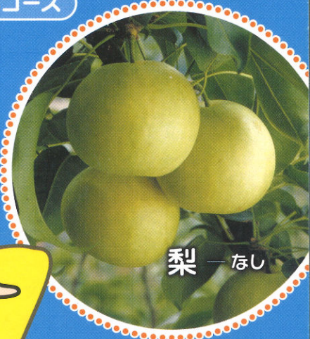
梨 - なし