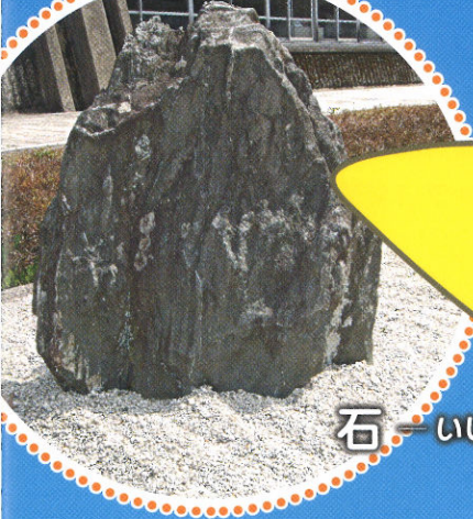
石 - いし