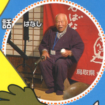
話 - はなし